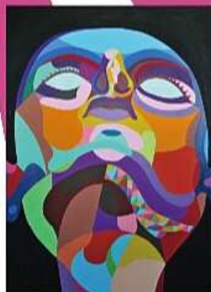
ゼミ作品「買め」 (ペンタ、グラフィックデザイン / 水谷優介)