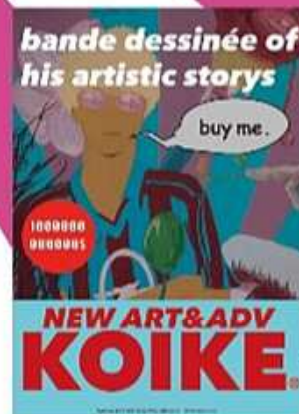
ゼミ作品「bande dessinée」 (Photoshop、Illustrator / 小松崎量介)